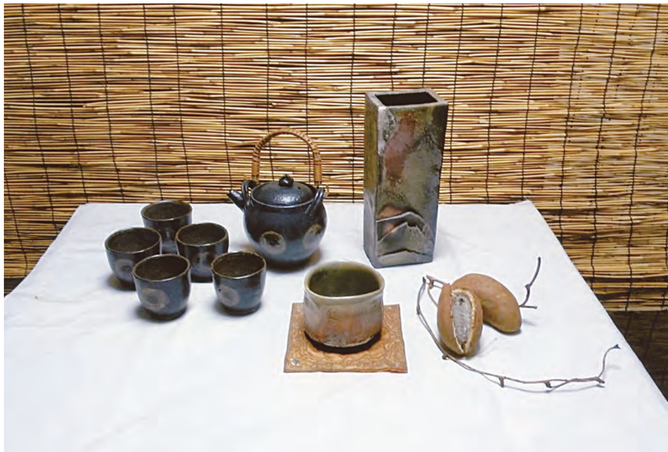
柏陶会 安達能理子 西上昭治 藤田美代子

令和4年(2022年)12月25日 発行者 柏原市文化連盟 TEL072-971-0013 FAX072-971-0014 http://www.k-bunren.jp